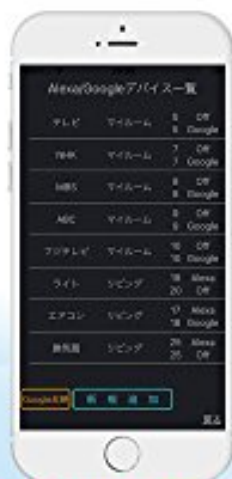
GoogleHome/Alexaアプリの「スマートホーム」に対応

「ねえGoogle、NHKつけて」 「アレクサ、テレビつけて」など簡単操作 呼び出しワードは無制限に設定できます。