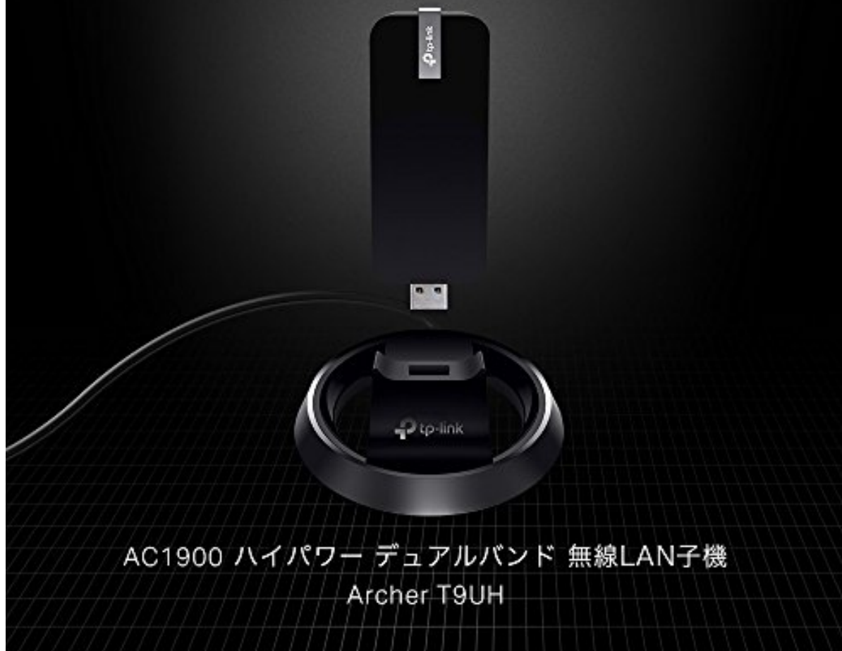
AC1900 ハイパワー デュアルバンド 無線LAN子機 Archer T9UH