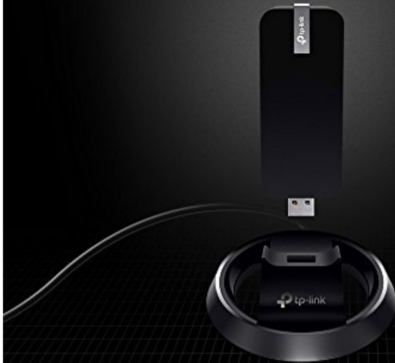
AC1900 ハイパワー デュアルバンド 無線LAN子機 Archer T9UH